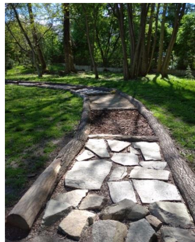
Obr. 4 – Hmatová stezka pro chůzi naboso

Prevence proti téměř všem ortopedickým problémům, posiluje imunitu, otužuje organismus, díky masáži reflexních plošek na chodidlech stimuluje orgány, zabraňuje zápachu nohou, je obranou proti plísním, zbavuje člověka škodlivého elektrostatického náboje, má příznivý vliv na spánek, prospívá redukci tělesné hmotnosti, pomáhá upravovat krevní tlak.