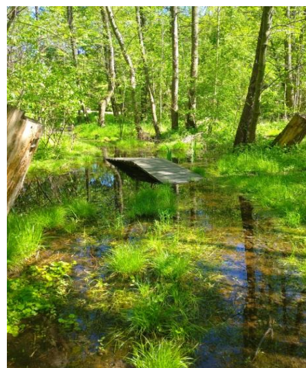
Obr. 3 – Mokřad pod Toulcovým dvorem

Vy pokračujte cestičkami podél Botiče . Po levé ruce můžete pozorovat meandrující tok potoka. Kolem Botiče vede spousta cestiček, takže můžete tok prozkoumat zblízka. Až se dostane do oblasti pod Toulcovým dvorem ( bod 4 v následující mapě), budete moci po pravé ruce za dřevěným plotem pozorovat lužní les a mokřad . Mokřad je přístupný z Toulcova dvora.