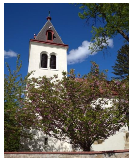
Obr. 1 – Kostel na břehu Hamerského rybníka