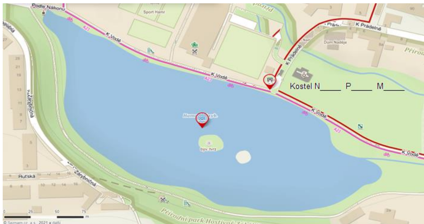
Mapa 2 – Hamerský rybník a jeho okolí

Od hmyzího hotelu pokračujte po břehu Hamerského rybníka , dokud nenarazíte na červenou turistickou značku (viz mapa). Po červené turistické značce se vydejte směr Trojmezí .