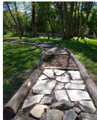
Obr. 4 – Hmatová stezka pro chůzi naboso

6) Vyjmenujte alespoň tři výhody, které jsou podle informační cedule chůzi naboso připisovány: