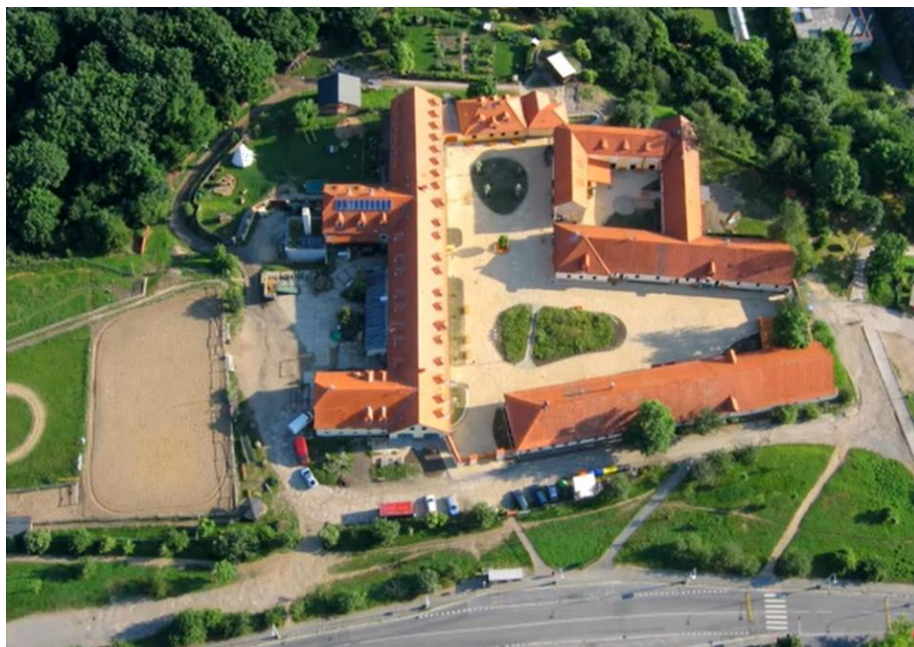
Obr. 5 – Toulcův dvůr