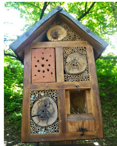
Obr. 2 – Hmyzí hotel na břehu Hamerského rybníka