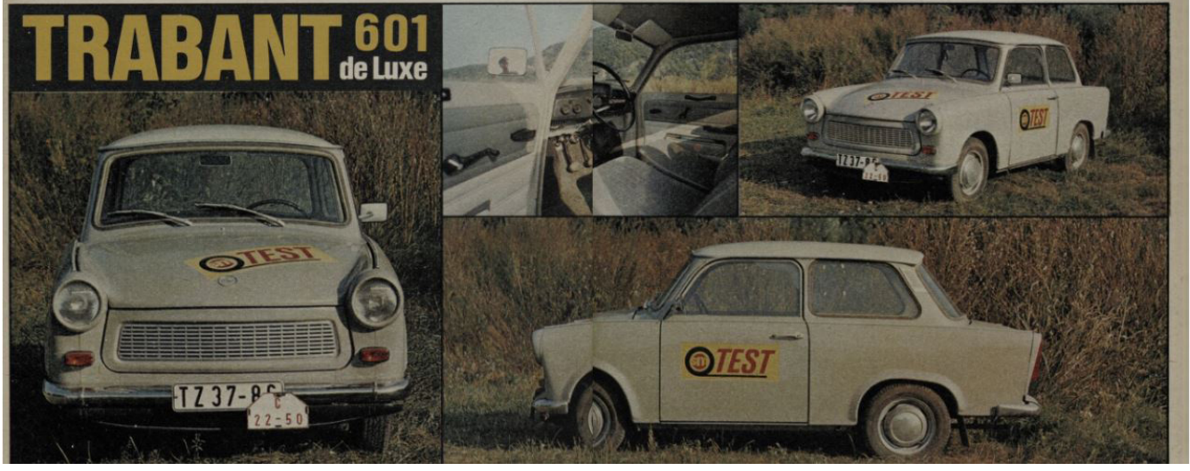
▲ Zdroj 3: Dvoustrana časopisu Svět motorů představující nový typ automobilu Trabant 601, Svět motorů, č. 42, 19. 10. 1973

■ Wartburg 353, nejetý. Zn.: Nabídněte – 7917 ■ Norton. Zn.: I nepojízdný – 7918 ■ Š 110 L, Š 100 L, Wartburg 353 Tourist, Wartburg 353. Od r. v. 1969. Uvedte r. v., km, popis, cenu, nabídn. Zn.: Za hotové – 7919 ■ Jawa 350 typ 354/06. Zn.: Do 1500 Kčs – 7922 ■ Trabant 601-combi v dobrém stavu do 22 000 Kčs, 15 000 Kčs hotově, zbytek na měs. splátky po 500 Kčs. Zn.: Ostravsko – 7923 ■ ŠMB, havarované, korodované, neodhlášené. Zn.: Cena – 7929