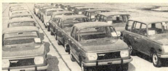
Vozy Wartburg 353 připravené k expedici do Anglie

Malý čtyřmístný vůz TRABANT 601 není jistě u nás potřeba nikomu zvlášť představovat, na silnicích ho potkáváme každodenně. Má ocelový skelet karosérie s povrchovými díly z plastické hmoty (Duroplast), je čtyřmístný a vyrábí se buď jako dvoudveřový tudor, nebo jako třídveřové kombi TRABANT 601 UNIVERSAL. Vzduchem chlazený dvoudobý motor o objemu 594,5 cm 3 dává výkon 19 kW [26 k DIN] a umožňuje vozíku o hmotnosti asi 615–650 kg (tudor – kombi) dosahovat maximální rychlost kolem 100–105 km/h.