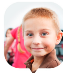
S DVOJÍ VÝJIMEČNOSTÍ