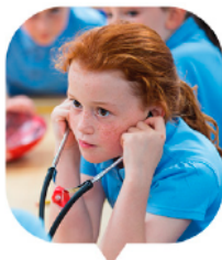
SKRÝVAČI SVÝCH SCHOPNOSTÍ