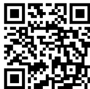
Hravá angličtina s ptáčky kiwi: Oblečení A1