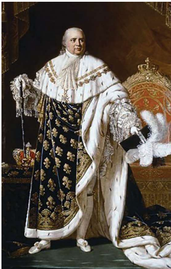
Na francouzský trůn se r. 1815 vracejí Bourboni, ale svět kolem je zcela jiný.

Marie Luisy, dcery Františka I.? Tak to ne, ozvou se ostatní. Ve Francii nechť je raději obnovena monarchie. Ale kdo usedne na trůn? Složitá jednání končí vítězstvím hraběte z Provence, Ludvíka XVIII., bratra popraveného Ludvíka XVI. A kdo ho navrhl? Napoleonův ministr zahraničí Talleyrand, který, světe div se, již dlouho před pádem svého chleboďárce tajně kolaboval s koalicí. Přísluší mu za to odměna v podobě postu ministra zahraničí v nové královské vládě. No, i převlékaný kabát sluší.