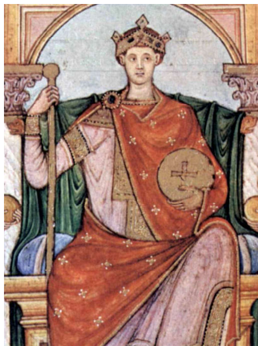
Otto II., prasnovec biskupa Wenera byl první, kdo přijal jméno Habsburg.

Někdo musí začít, a tak Wernerův prasnovec Otto II. je prvním, kdo přijímá jméno hrabě z Habsburgu. Zrodila se dynastie! Otto je také prvním z rodu, kdo se vyzná. Plejáda politických funkcí, které drží, nese víc než zlatý důl. Stejně jako dnes. V regi-