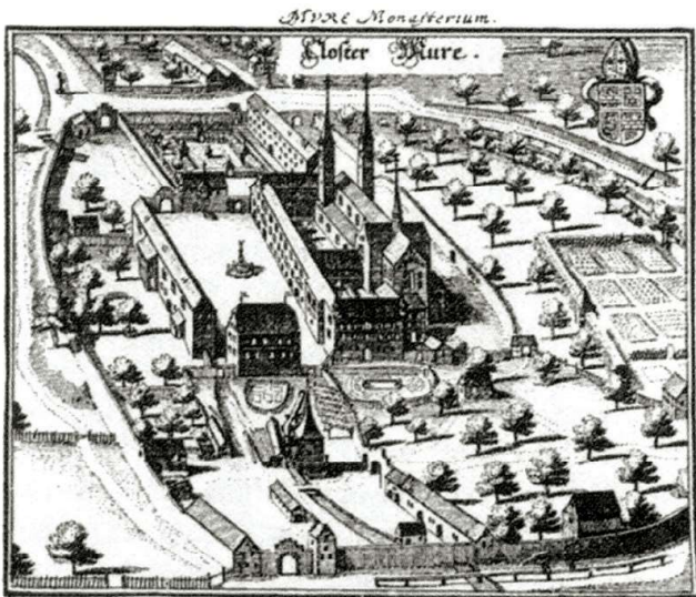
Kláster Muri, jehož Loretánská kaple je rodiinou hrobkou Habsburků.

Vzájemnými provokacemi a střety se oba sokové blíží bitvě na Moravském poli v roce 1278, jejíž výsledek ale už známe. Rudolf I. po vítězství vstupuje do Přemyslovi dříve nakloněné Vídně, z níž učiní své sídlo a ze které v dalších letech zvolna buduje novou říši. Se souhlasem kurfiřtů uděluje v roce 1282 synům Albrechtovi