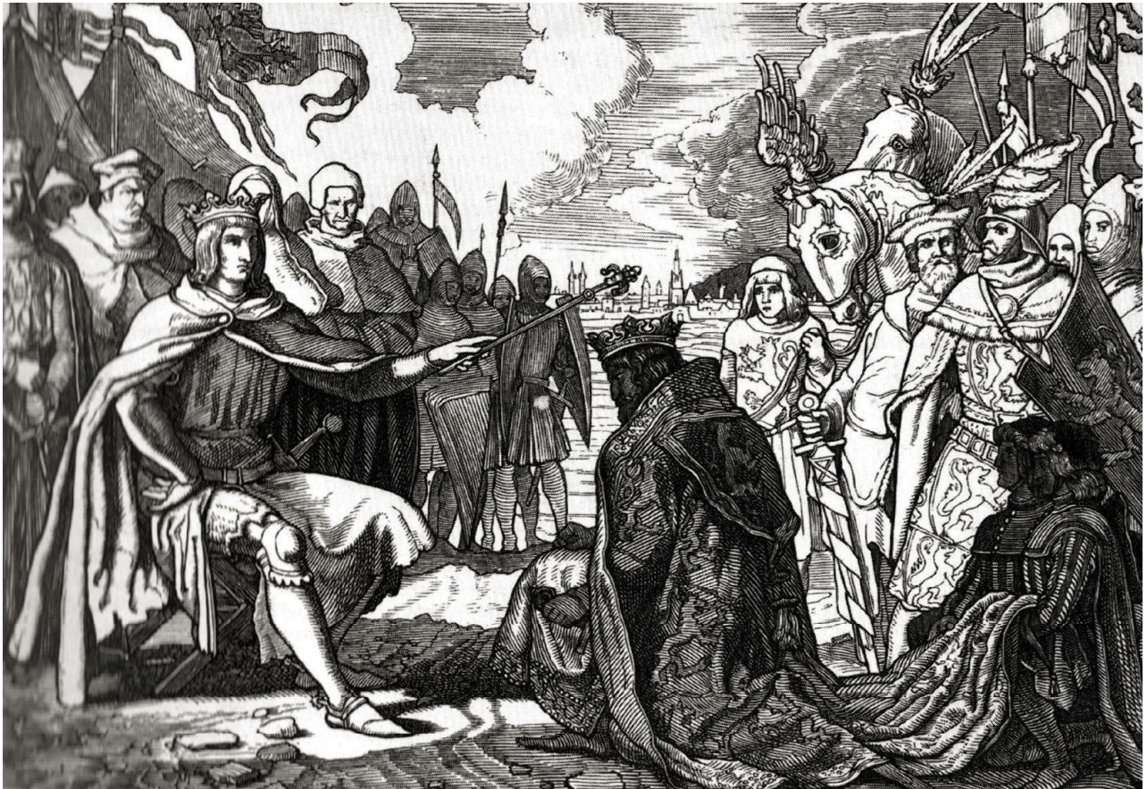
Rudolf, nedbale oblečen, přijímá jako římský král vynucený hold Přemysla Otakara II.

položen v roce 1276 za panování Přemysla Otakara II. Po zmíněných měsících musí sedmiletý Přemyslův syn, jinak budoucí český král Václav II., před Svatoštěpánským dómem na kolenou Rudolfa veřejně prosit o vydání otceva těla. V následujících letech je hlavním Rudolfovým cílem upevnění vlády a rozšíření získané pozice. Dobře ví, že český trůn je jedním ze základních kamenů cesty k cíli, a to nejen pro bohatství jeho stříbrných dolů. Důležitý je i politický vliv, jež má hlas českého krále jako jednoho z kurfiřtů volících krále Svaté říše římské. Jen sedm mužů smí volit římského krále. Jsou cosi jako dnešní eurokomisaři, ale s mnohem větším vlivem i bohatstvím. Tři církevní hodnostáři, arcibiskup kolínský, mohučský a trevírský, a čtyři světská knížata, falckrabě rýnský, vévoda saský, markrabě braniborský a král český! Zastávají i vysoké říšské úřady, arcikancléř, arcikomorník, arcistolovník či arcicíšník, což je titul patřící českému králi. Půvabné názvy, že?